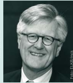
Heinrich Bedford-Strohm Ratsvorsitzender der EKD und Landesbischof der bayrischen Landeskirche